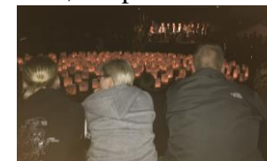
”Stafet for livet”

Repræsentanter fra Ældrerådet har deltaget ved kommunens 75 år fødselsdag samt ved Centerrådsvalgene, hvor repræsentanterne har orienteret om Ældrerådets virke.